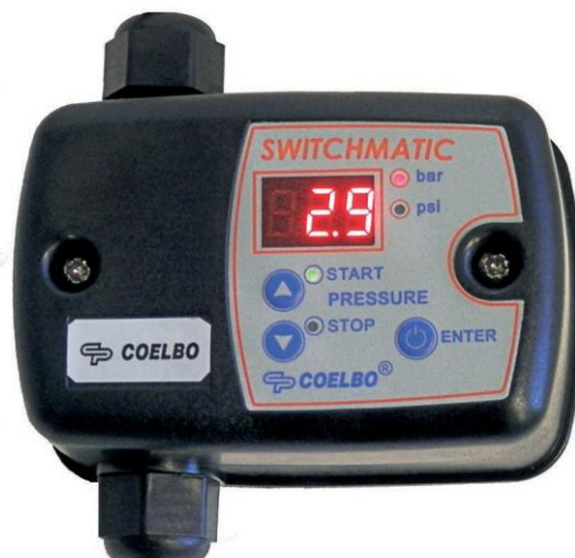
SWITCHMATIC SWITCHMATIC 2