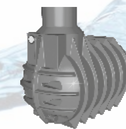
BL-30 (6 PE) + BL-45 (8 PE)