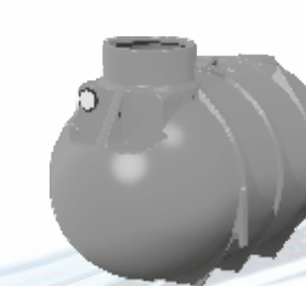
BL-26 (5 PE)